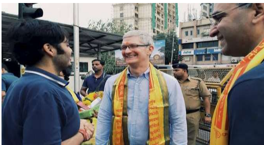
CEO Tim Cook trong một chuyến thăm đến Ấn Độ.

Nếu kế hoạch thành hiện thực, Apple sẽ trở thành công ty xuất khẩu lớn nhất Ấn Độ, với sản lượng xuất khẩu tới 40 tỷ USD trong 5 năm tới. Đảm nhiệm sản xuất chính cho Apple tại Ấn Độ là hai công ty quen thuộc Wistron và Foxconn.