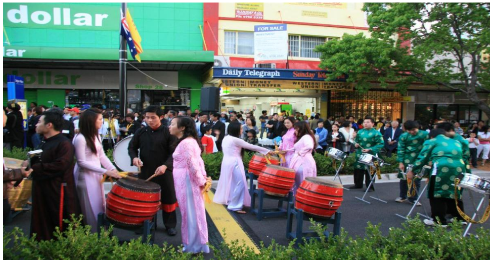
Chuẩn bị cho Lễ Khánh Thành Tượng Đài Thuyền Nhân ở Sài Gòn Place Lễ Khánh Thành Tượng Đài Thuyền Nhân Việt Nam