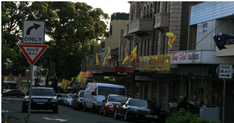
Cờ Vàng treo dọc dãy phố Sài Gòn Place