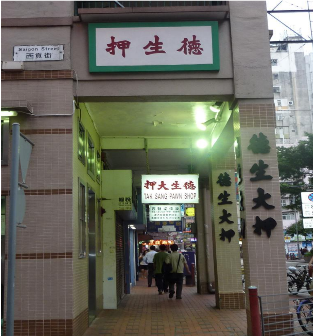
Sài Gòn Street ở Hồng Kông nơi một số người Việt Tỵ Nạn còn cư ngụ ở đây