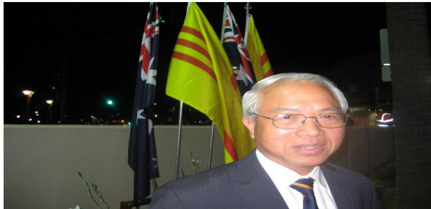
Ông Chủ tịch CDNVTĐ NSW