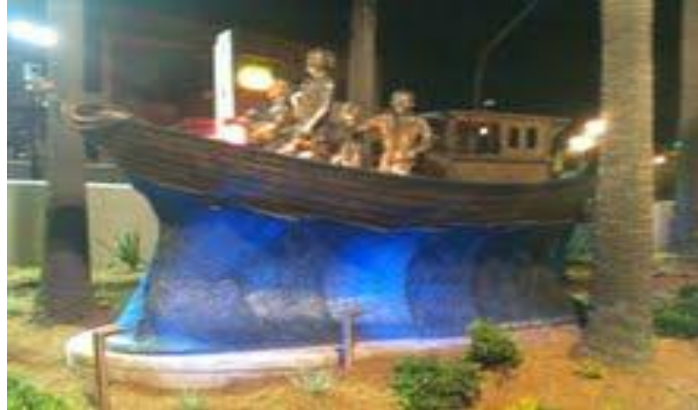
Tượng Đài Thuyền Nhân Việt Nam