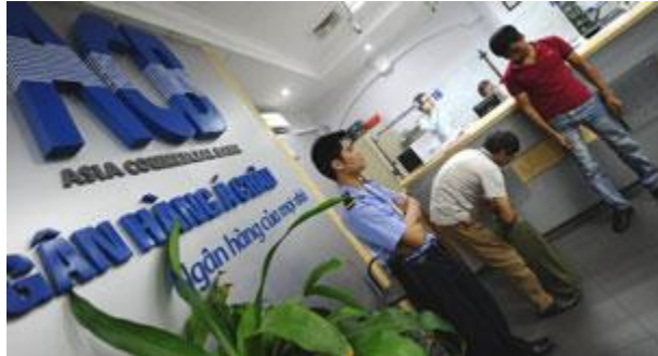
Một điểm giao dịch của ngân hàng ACB tại Hà Nội hôm 23/8/2012