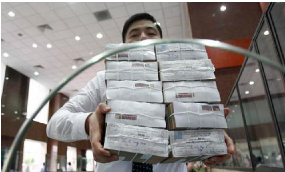
Theo số liệu của WB, mỗi người dân Việt Nam gánh hơn 1.200 USD nợ công.

Số liệu này cao hơn mọi công bố từ trước tới nay của các cơ quan Việt Nam, và như vậy mỗi người dân đang gánh trên 1.200 USD nợ công, tương đương hơn nửa năm thu nhập.